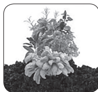
Day 21* Día 21* Jour 21* Tag 21*

for reordering additional seed balls, see retailer information on: www.JumpStartseedstart.com