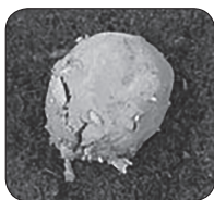
Seed BALL Day 1 Semilla día 1 Semence jour 1 Saatgutkugel Tag 1

*HINWEIS: Das Wachstum kann je nach der Pflanzenart und den Anpflanzungsbedingungen in unterschiedlicher Weise verlaufen.